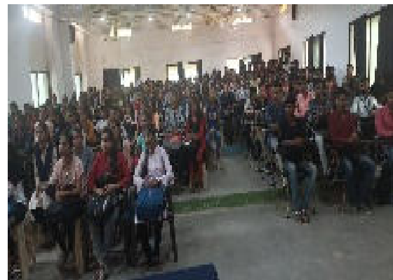
Figure 1 Students attendance at Hall