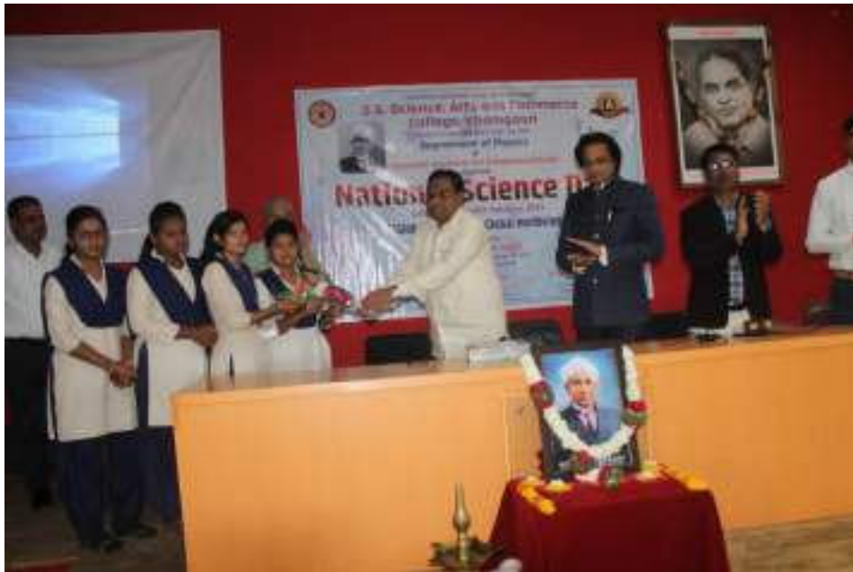
Honorable guests felicitating the students