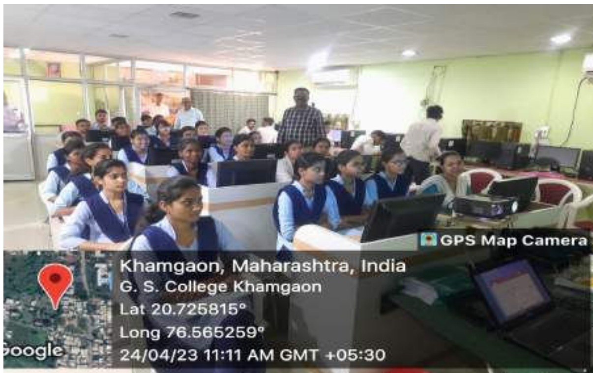
Students of M.Sc. I and II attended workshop