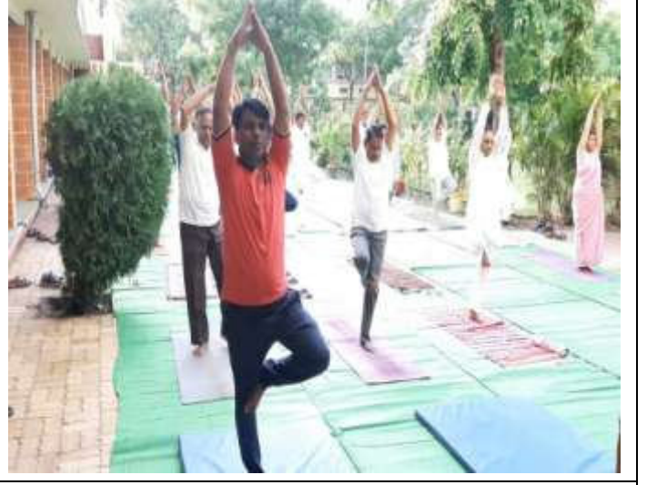
Some Glimpses of the Event: International Yoga Day 2022