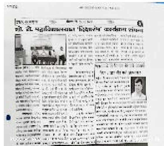
Figure 3 Program news published in newspaper