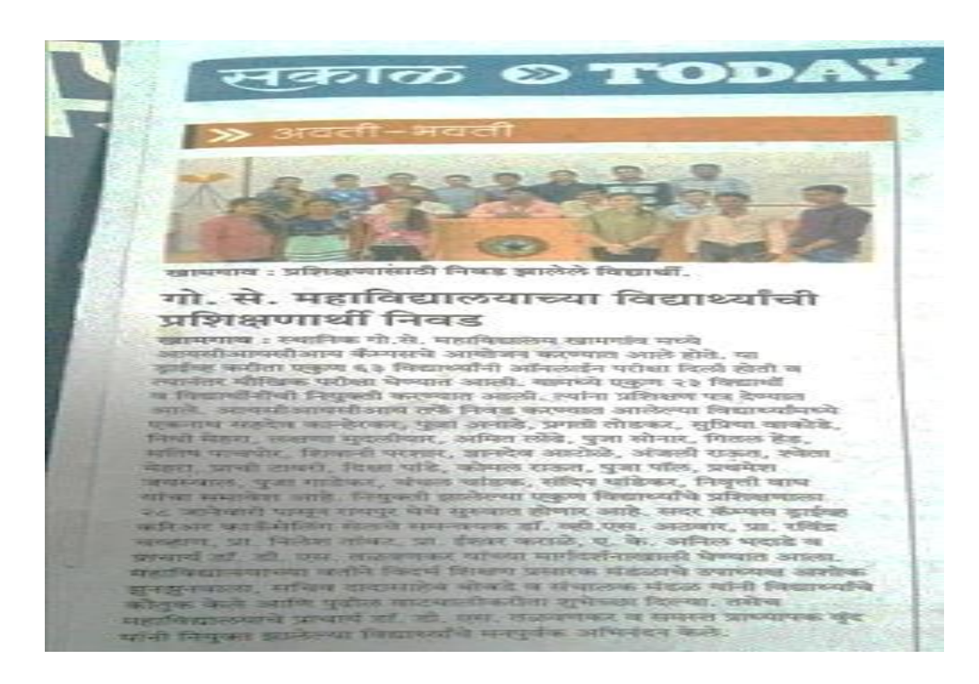
ICICI News Sakal news paper