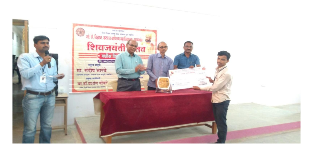
Got I Prize of Rs 2000/-