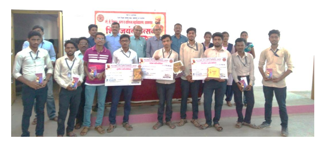
Group Photo who got prize in Shiv Jayanti competitive test held on 15/02/2019