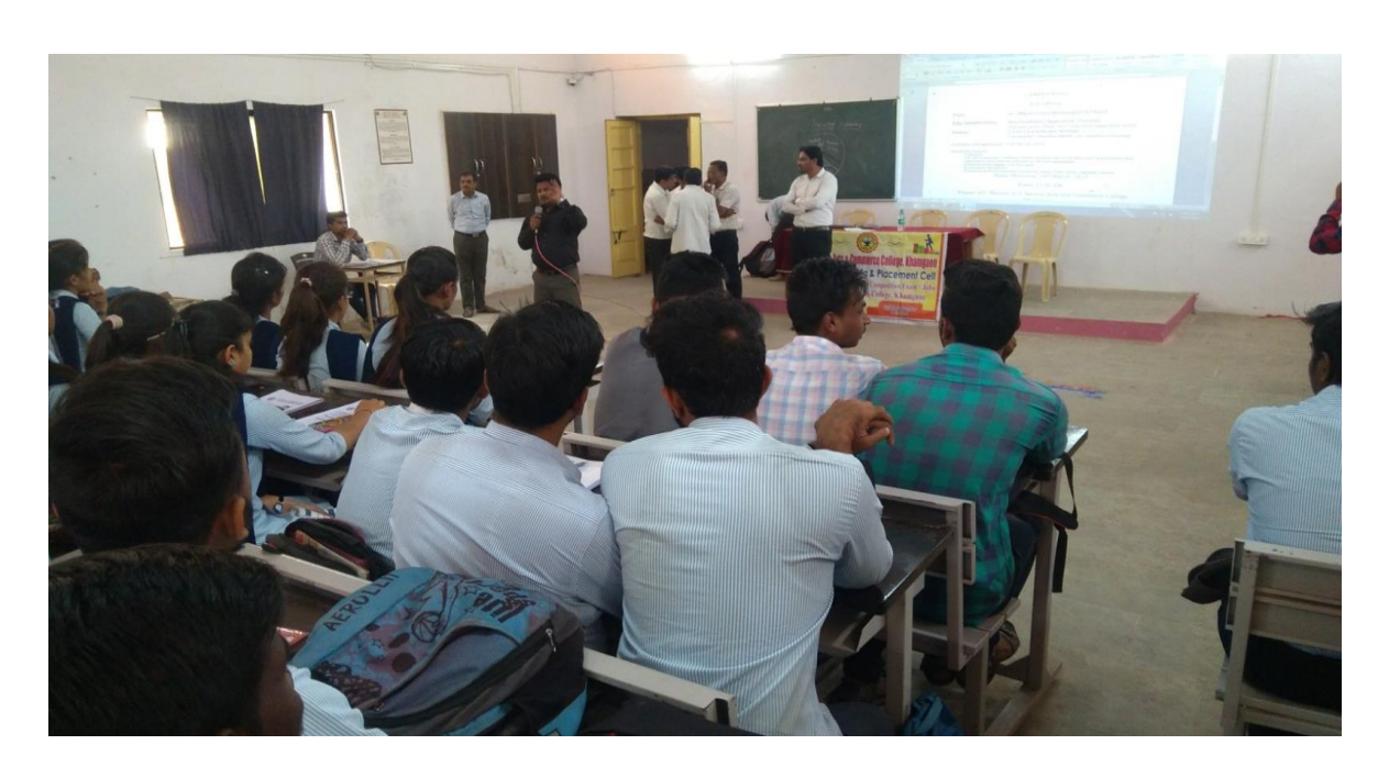
WIPRO campus drive 23/04/2019